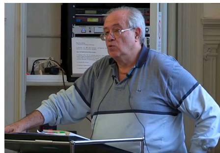
Jacques-Alain Miller

Il ne répond pas du tout aux critiques fondamentales détaillées dans le fameux "Livre noir".