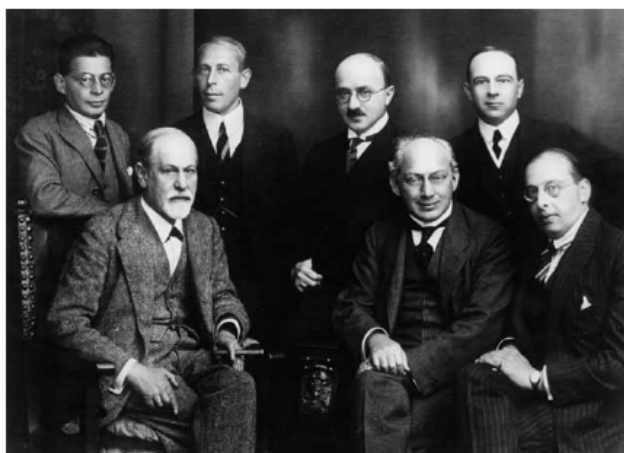
Ferenczi est au 1 er rang, entre Freud et Hanns Sachs

En 1912, suite à la rupture de Freud avec plusieurs de ses confrères et disciples, Ferenczi crée un « Comité secret », destiné à veiller à la pureté doctrinale de la psychanalyse freudienne. (Le comité était composé de Freud, Abraham, Eitingon, Ferenczi, Jones, Rank, Sachs).