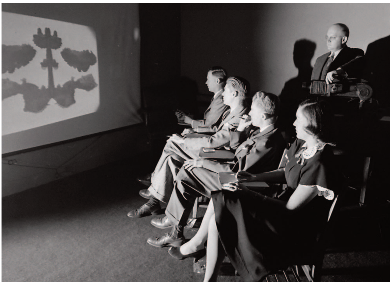
Een sessie met rorschachplaten in de jaren veertig.