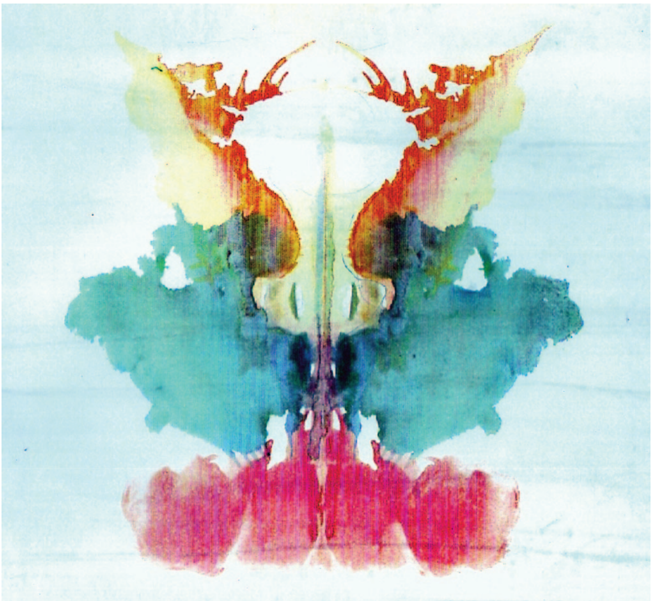
Plaat 9 van de rorschachtest.