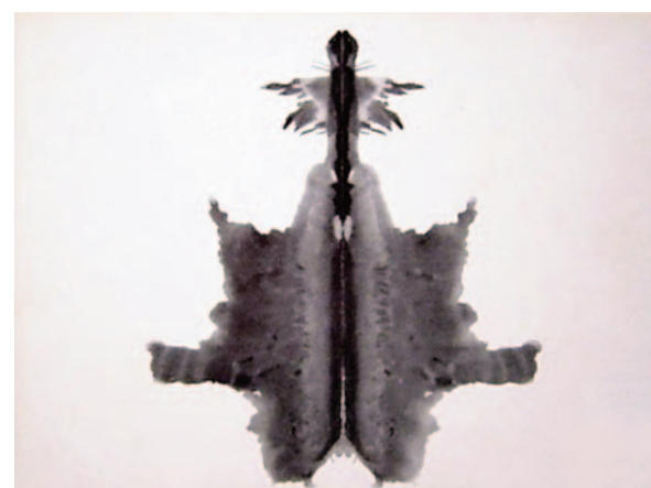
Plaat 6 van de rorschachtest.

De universeel aan deze prent toegekende betekenis maakt hem tot seksuele prent par excellence . Het Grote detail bovenaan evoqueert een fallisch symbool, het Kleine in het midden een vaginaal. Een moeiteloze of zelfs euforische interpretatie van deze sneden toont een (hetzij vrouwelijke hetzij mannelijke) seksualiteit die is aanvaard en geïntegreerd in de persoonlijkheid. (Bijvoorbeeld: onderste helft van het Groot detail: een mooi en rijk dal omringd door ronde heuveltjes). Tekenen van seksuele problemen bij het subject: een weigering om te interpreteren, antwoorden met een angstige lading (bijvoorbeeld een in twee gesneden dier), een uitbreiding van de seksuele symboliek van eerdere prenten, vooral rondom die met een centrale lijn ('vuiligheden'). Groot detail beneden: hoofd van een koning = problemen met gezag, ambitieus. Middellijn: projectiel of schip dat aarde, zee of lucht doorklieft = paranoïde of homoseksuele neigingen. Klein heldergrijs detail in het midden: nest, eitje = infantiele regressie dan wel preoccupatie met de voortplanting. 19