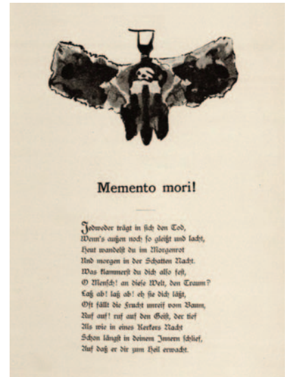
Pagina uit Klecksographien .

Hermann Rorschach werd in 1884 geboren in Zürich, en deed er een deel van zijn studies geneeskunde. Het hospitaal van Bleuler was een wereldvermaard centrum voor psychiatrie en psychoanalyse. Rorschach werd er vanaf 1912 gepokt en gemazeld in de freudiaanse analyse (weliswaar zonder zelf in analyse te zijn geweest, hetgeen toen nog niet verplicht was om erkend te worden als psy-